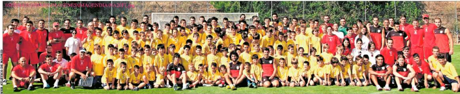
MEZCLADOS Y CON RISAS. Los chicos de la Fundación posaron el verano pasado con los integrantes de la primera plantilla del Atlético de Madrid en las instalaciones de Majadahonda.